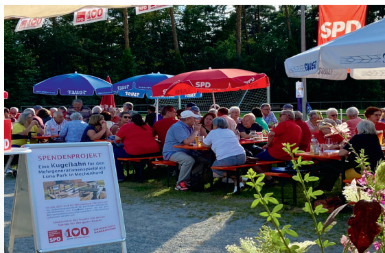
Impression vom Sommerfest im Juli