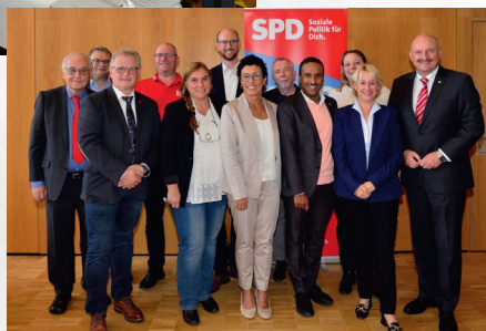
Ehrengäste und Mitglieder der Stadtratsfraktion

Es waren Sozialdemokraten, die für Gleichberechtigung eingetreten sind und noch heute aktiv eintreten. Und es sind auch heute noch Sozialdemokraten, die für Demokratie und Rechtsstaat eintreten und die auch die Schwächsten in der Gesellschaft im Blick haben.